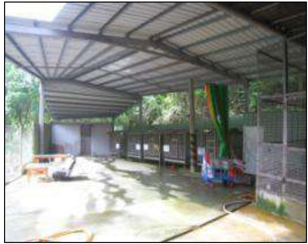
嘉義縣民雄鄉動物收容處所入口及犬欄