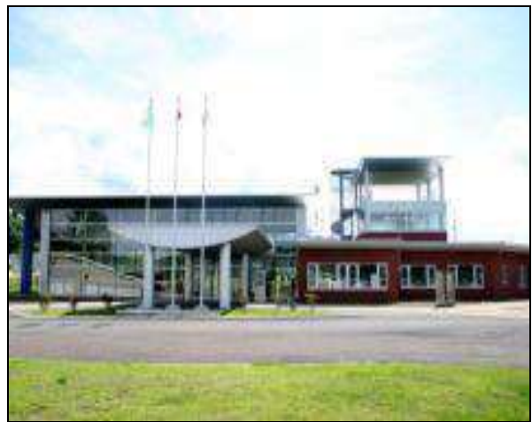
日本青森縣的動物愛護園區