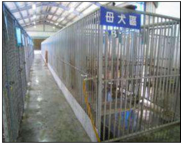
臺東縣動物收容處所入口及犬欄