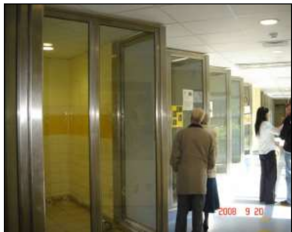
英國 Harefield 犬隻收容所