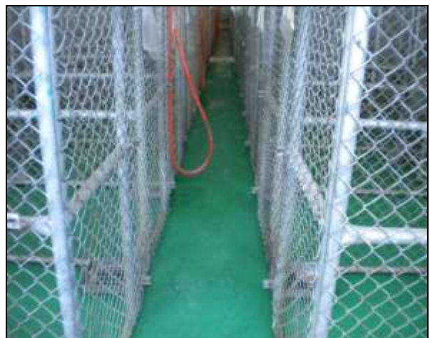
彰化縣員林鎮動物收容處所入口及犬欄