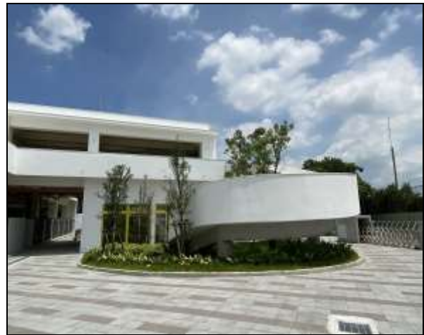
110年完工啟用之臺中市動物之家后里園區