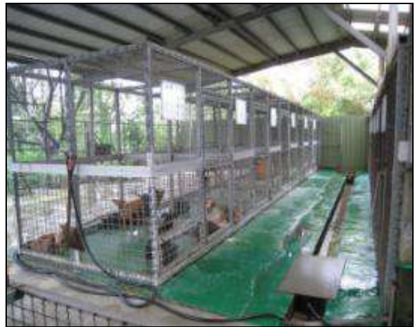
苗栗縣苗栗市動物收容處所入口及犬欄