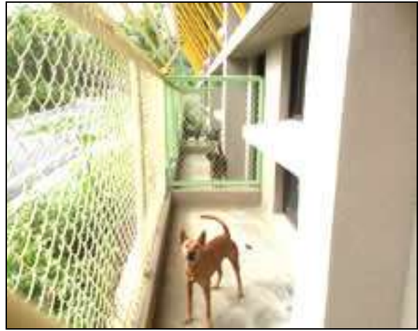
105年完工啟用之高雄市燕巢動物保護關愛園區