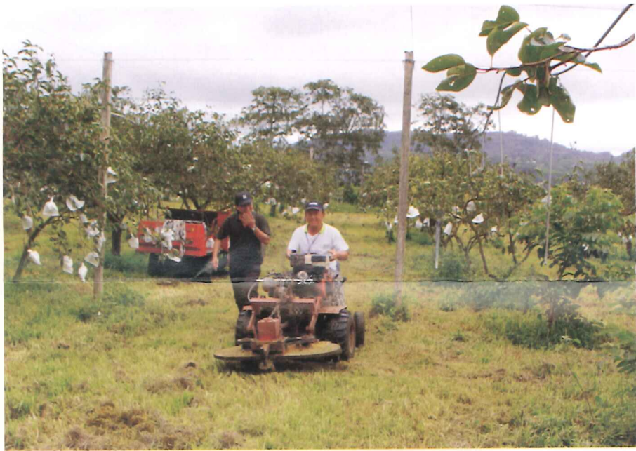
園丁學員體驗操作農機具情形