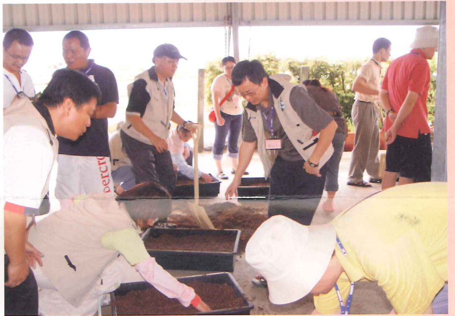
學員體驗無土植盤栽培

今年度農委會委由各區農業改良場辦理園丁計畫，推動35-60歲有興趣農業體驗的一般民眾參與，期望引入的農業生力軍能一同留農耕耘。本場依據此依精神涵義，設計每一梯次5日4夜之活動，時間分別為7月23日至27日、8月4日至8日入門班共2梯次，學員人數共計62人，體驗活動行程規劃囊括了糧食作物、特用作物、花卉及蔬菜、果樹、植物病蟲害防治以及休閒農業等相關主題做概念性的教育訓練，9月8日至12日開設之保健植物進階班，課程內容包括保健植物機能性成分簡介、保健產品研發現況及產品開發、保健植物與護膚產品之應用、保健植物與農產品