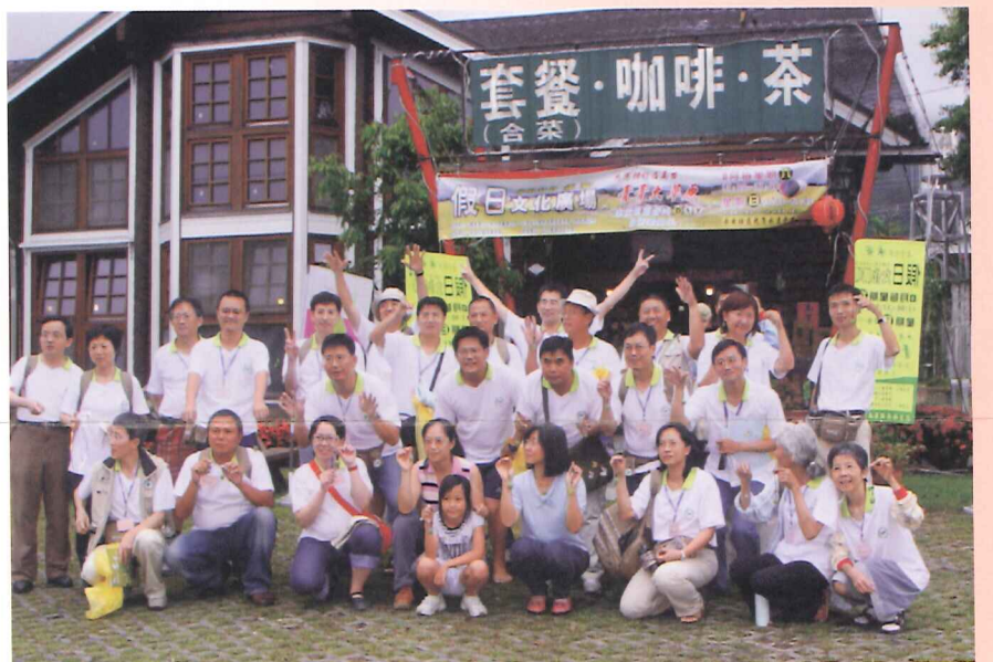
學員參訪十大經典社區——永安社區

今年度農委會委由各區農業改良場辦理園丁計畫，推動35-60歲有興趣農業體驗的一般民眾參與，期望引入的農業生力軍能一同留農耕耘。本場依據此依精神涵義，設計每一梯次5日4夜之活動，時間分別為7月23日至27日、8月4日至8日入門班共2梯次，學員人數共計62人，體驗活動行程規劃囊括了糧食作物、特用作物、花卉及蔬菜、果樹、植物病蟲害防治以及休閒農業等相關主題做概念性的教育訓練，9月8日至12日開設之保健植物進階班，課程內容包括保健植物機能性成分簡介、保健產品研發現況及產品開發、保健植物與護膚產品之應用、保健植物與農產品