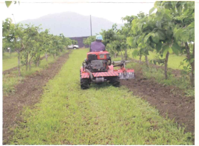
果園中耕除草機中耕部伸入果樹冠下中耕除草作業