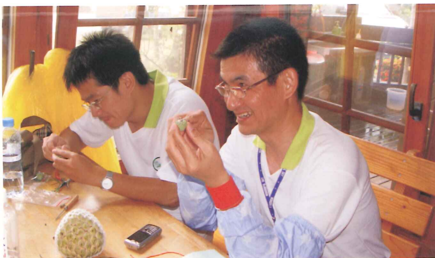
學員體驗製作乾果飾品