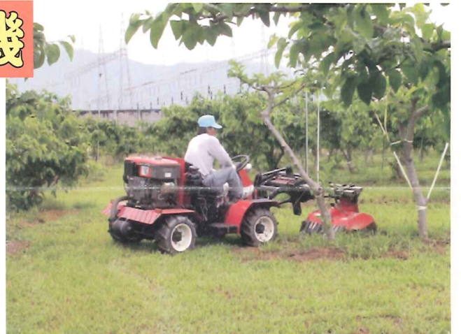
果園中耕除草機田區轉彎四輪轉向

研成之果園中耕除草機本機以16馬力柴油引擎為動力、四輪驅動、四輪轉向，設計四輪驅動使果園中耕除草機適應在石礫地、鬆軟土壤等不良環境作業，果園轉彎亦可利用四輪轉向機構，減少轉彎半徑，方便田區行駛，提升工作效率，速度前進六速、後退二速，最快行駛速度每小時15公里，可快速至果園工作。中耕部寬度60公分，刀管可安裝中耕刀、掘刀、培土刀，但以安裝掘刀性能較佳，能適應不同情況及環境下果園作業之需求，刀軸每分鐘轉速約為440-470轉，中耕部安裝在本機