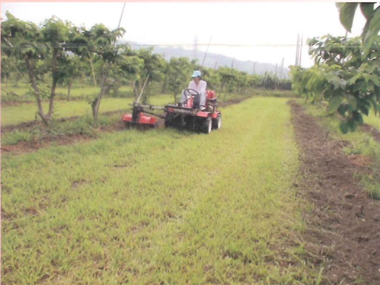
果園中耕除草機中耕除草作業