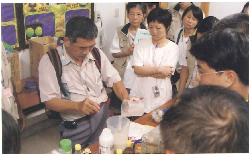
講師示範如何自製植物萃取液來防治害蟲

加工應用等，研習目的在於鼓勵退休的優質人力資源進入自然環境，重新思考生活的價值及意涵，這對於嚮往戶外生活環境，樂於融入自然環境考驗的朋友而言，這次的活動確確實實帶來不少的迴響與震撼，學員課後反應未來再繼續深入了解農業的相關課程的動機也很強。