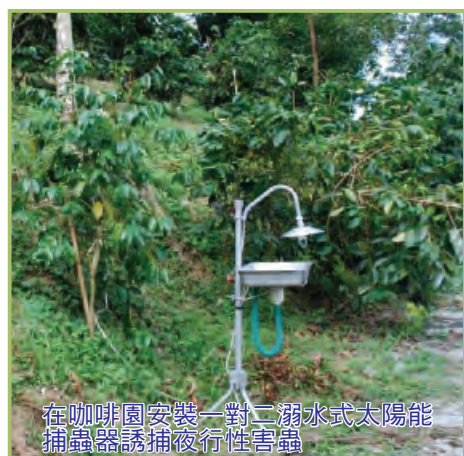
在咖啡園安裝一對二溺水式太陽能捕蟲器誘捕夜行性害蟲

溺水式太陽能捕蟲器主要由可伸縮高度主體架、太陽能板、蓄電及供電控制單元、黑紫色誘蟲燈、溺水盤誘捕裝置等組成，以20W單晶太陽能板供應電源、12伏特12Ah蓄電池儲藏電力，以倍數定時積體電路板做為穩壓供電控制單元、利用光敏電阻感測控制亮燈時刻、在設定時間內持