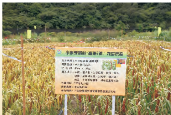
小米臺東8號生長情形