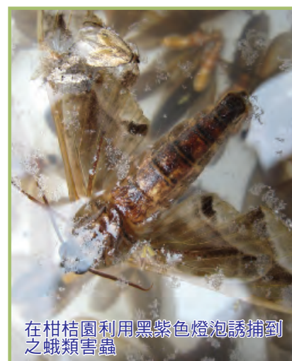
在柑桔園利用黑紫色燈泡誘捕到之蛾類害蟲

使用溺水式太陽能捕蟲器誘捕害蟲要發揮最佳效能，由試驗結果顯示，其在田間安裝位置、使用燈泡波長、亮燈時刻及溺水盤高度密切相關，因此農民對誘捕害蟲發生之生態習性要多加注意了解，溺水盤安裝在適當高度，配合害蟲出沒時刻亮燈，必可提高捕蟲數量，發揮燈光誘捕之效果。