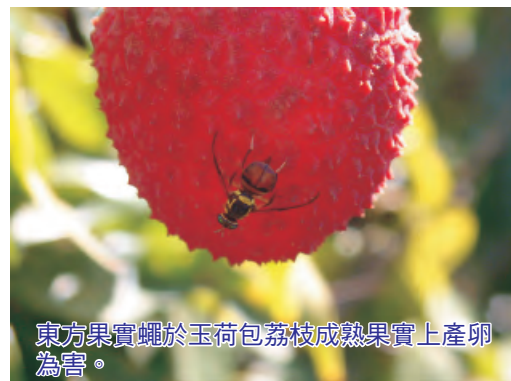
東方果實蠅於玉荷包荔枝成熟果實上產卵為害。

依據本場果實蠅密度監測結果顯示，近日來氣溫回暖，太麻里地區果實蠅密度有升高的趨勢。請農友定時更新果實蠅誘殺資材，利用果實蠅長效型誘殺器誘殺雄蟲，並配合於果園週遭之