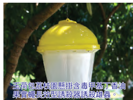
玉荷包荔枝園懸掛含毒甲基丁香油果實蠅長效型誘殺器誘殺雄蟲。

制。農友可至各鄉鎮區農會領取含毒甲基丁香油誘殺雄蟲，並聯合鄰近果農進行田間共同防治。如有防治上的疑問，請逕洽本場洽詢。