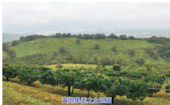
賓朗果園之全區圖

臺灣因地處亞熱帶，氣候高溫多濕，作物之病蟲害發生頻繁，農業栽培偏用農藥及化學肥料，造成自然環境的改變與破壞，如土壤酸