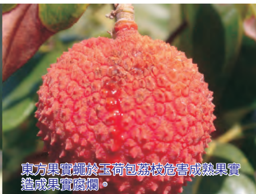
東方果實蠅於玉荷包荔枝危害成熟果實造成果實腐爛。

雜樹林點噴「0.02%賜諾殺濃餌劑」10倍稀釋液，全面誘殺雌蟲及雄蟲；更要加強田間衛生管理，清除受害落果，並行果實套袋防範此蟲為害。此外，臺東地區番荔枝雖未達果實蠅為害時期，也請農友注意防治工作，避免後期果實蠅密度過高無法控