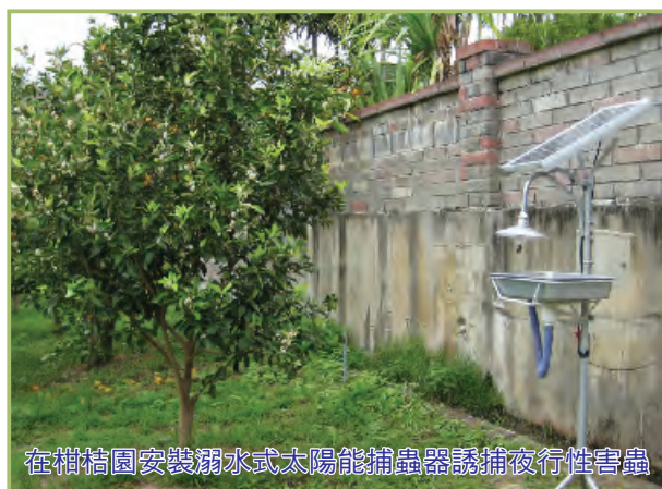
在柑桔園安裝溺水式太陽能捕蟲器誘捕夜行性害蟲

利用蛾類等夜行性昆蟲之趨光特性，以誘捕器具捕捉夜行性為害農作物害蟲，可做為夜間蟲害防治及監測害蟲發生密度之工具，並達到減少農藥使用及避免施藥殘留的風險。誘捕器具種類繁多，有使用110伏特交流電者或使用12伏特直流電者，在田間安裝誘捕器具捕蟲常遭遇到電源供應問題，使用大自然綠色能源之太陽能捕蟲器方式捕蟲，電源供應及田間安裝方便實用，但利用太陽能捕蟲器捕蟲也會遭遇連續陰雨天日照不足供電問題，需提供充足電源克服。