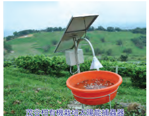
茂谷柑有機栽培太陽能捕蟲器

40公斤/株/年）。經一年採有機方式管理後，當年度果實產量與往年使用慣行農法之產量相似，且果實品質頗佳，其果實可溶性固形物含量達13~15度Brix之間。