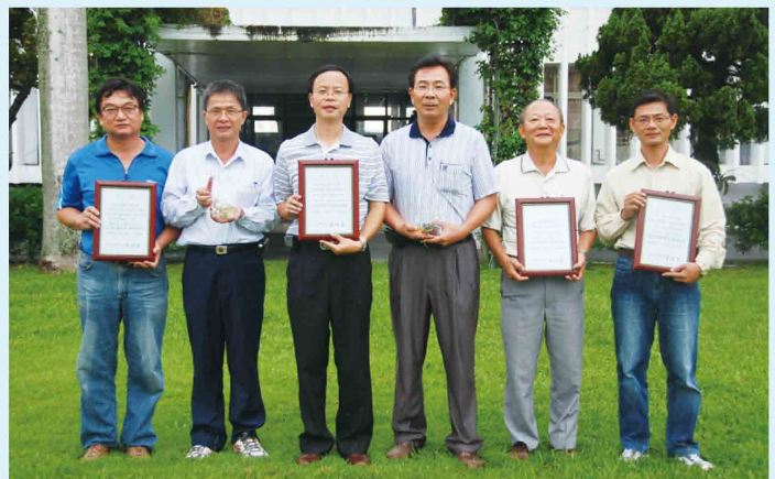
本場榮獲農委會十大研究團隊重大研發實績獎

場長學詩嘉勉得獎同仁在農業科技研究之投入與貢獻，更期許所有研究人員繼續努力，以爭取優良成績。