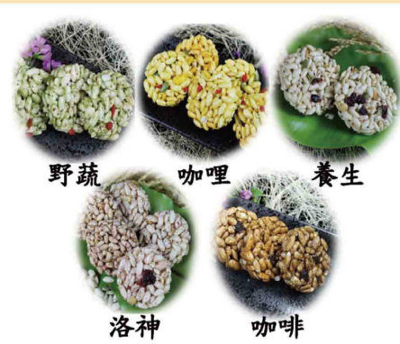
縱谷米香好伴手 - 多元養生米香產品