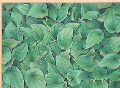
●魚腥草保健功能強大

魚腥草之藥性，依文獻所載；《本草綱目》：“辛，微溫，有小毒。”《滇南本草》：“性寒，味苦辛。”《別錄》：“味辛，微溫。”《醫林纂要》：“甘辛鹹。”用於清熱解毒，利尿消腫。《本草再新》：“入肝、肺二經。”其主治功用在於治療肺炎、肺膿瘍、肝炎、腎炎水腫、狹心症、心肌梗塞、高血壓、糖尿病、中風、支氣管炎、百日咳、腳氣病、尿路感染、白帶過多、淋病、瘡疾、痔瘡、癰腫、香港腳、腹股溝癬、鼻蓄膿、鼻竇炎、中耳炎、蕁麻疹、濕疹、消化不良、毒蛇咬傷等，效用實在驚人，但最主要還是用於肺癰。此外亦可應用於抗癌，作為複方之輔助藥劑應用。