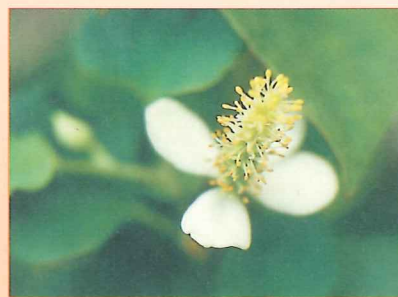
●魚腥草之白色小花及花序