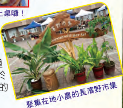
聚集在地小農的長濱野市集

石鼻，更值得一提的是頗具歷史價值的安通越嶺古道，這條古道以玉里鎮安通為起點，橫跨海岸山脈連通東部