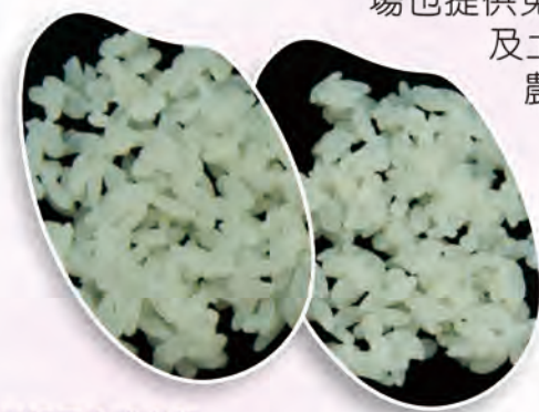
以相同方式煮飯，過量氮肥的米口感脆硬且水份少而乾(圖左)，合理化施肥白米表面有光澤而軟Q(圖右)

農友在生產時希望能提高產量並兼顧品質，而消費者則注重健康安全及口感。合理施用氮肥，可以穩定稻米產量並且維持品質，使白米晶瑩透亮，軟Q好吃。為提高農友對作物生育情形及土壤資訊的瞭解，本場免費提供水稻葉色板及土壤採樣袋，協助農友確保高品質的稻米，達成永續生產的目標。