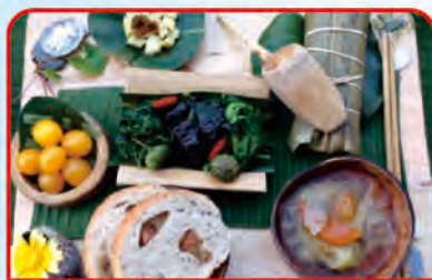
色香味俱全的在地美食上桌囉！

沿省道臺11號公路，從花蓮南下或自臺東北上均可抵達長濱，在2007年玉長公路開通後，拉近了長濱及成功等東海岸地區與花東縱谷的距離，不僅改善了當地居民對外聯繫的交通，也豐富了遊客旅程規劃的選項。來到長濱最讓人耳熟能詳的旅遊景點，無非就是極具文化遺址價值的八仙洞、加走灣、白桑安及忠勇等處，也有讓人流連忘返的濱海漁村風情的烏