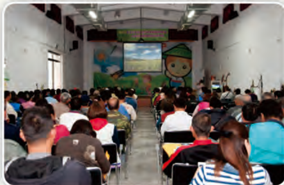
農友們在關山鎮農會-米國學校展開5天的農業學習之旅