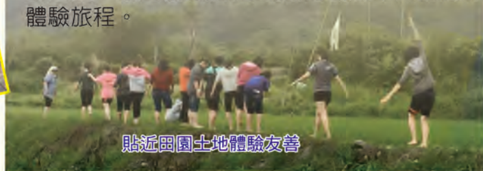
貼近田園土地體驗友善

近幾年有不少來自外地的新移民，多以寄情自然田野及從事農業生產為主，足見長濱鄉間適景緻及慢活步調，對於長久居住於都市民衆的吸引力；在1月起，這些用心在地經營的夥伴們，更以「長濱野市集」(Kakacawan wild market)開啓了在地農產市集的新頁，小農們帶著自家生產的農特產品，與喜愛親近市集及在地農業的消費者直接互動，透過彼此的交流，傳遞「不僅是交易，更要重建人與土地的彼此信任及相互感動」；落實「以人為本、以愛為念」的在地行動，迄今已成功辦理了3次活動，在臉書上也吸引了不少關注，5月9日將是第四次的市集活動，建議您可以在初夏的週末，抽空來趟專屬於您與家人的自然農趣田野之旅，想必能讓您闔家擁有截然不同的鄉村體驗旅程。