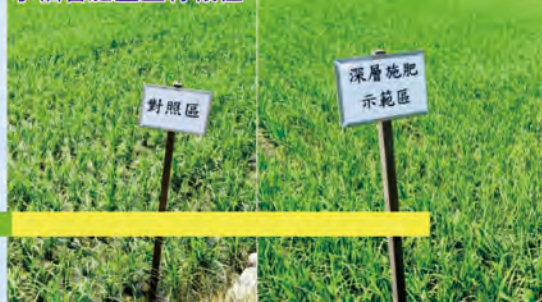
使用水稻插秧兼側條深層施肥後，水稻省肥且生育較佳

本次示範結果顯示，採用側條深層施肥，氮肥節省17.1%，磷肥節省55.6%，水稻分蘗數卻可增加11.0%，株高和葉色值都有提升，表示在節省肥料的情形下，水稻還可以發育得更好，能節省肥料成本及人工成本。而在病蟲害方面，接近清明降雨期間，溫度與濕度變化大，水稻的感冒—「稻熱病」也容易發生，除了慎選用藥安全防治外，也必須配合水稻的生育合理化施肥，避免肥料過量造成病害蔓延。