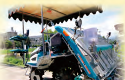
示範區所使用的水稻插秧兼側條深層施肥機

多新的管理方式；近幾年漸漸發現，過去施肥時將追肥分成2次的做法，因為部分的農友年紀大了，背著肥料撒布機走著泥濘的田區施肥是個很大的負擔，不僅肥料加機器重量接近30公斤，還必需要專注的操作才能讓肥料均勻的撒在田裡，本場教導插秧兼側條深層施肥的方法，在插秧時就把肥料放好了，用量少還不容易流失，效果比一般的施肥方式還好，最重要的是追肥的肥料錢也省下來，不用背著機器踩著濕泥巴施肥了。