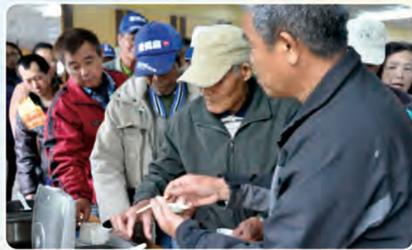
農友品嘗不同肥料處理的米飯口感

一、依照目標產量設定施肥量，以1公頃生產6,000公斤乾稻穀為例，第1期作推薦全期氮肥用量應為140~160公斤/公頃(換算成硫酸銨為670~760公斤)，第2期作為120~140公斤/公頃(換算成硫酸銨為