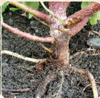
圖1b. 莖基部呈濕潤狀褐化