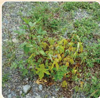
圖1a. 洛神葵莖腐病植株黃化萎凋