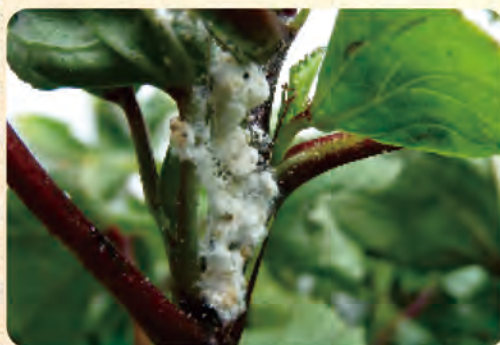
圖3b. 扶桑綿粉介殼蟲

洛神葵多分布於山地鄉，採粗式栽培，病蟲害少受重視，且核准登記用藥不多，但為確保產量與品質，仍需正