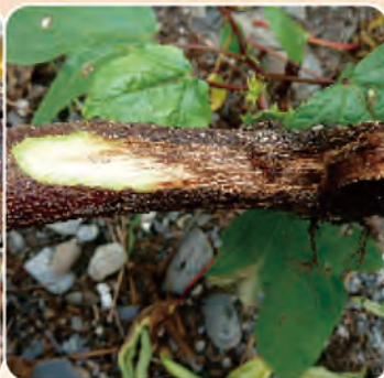
圖1d. 削開樹皮可見維管束變黑褐色

洛神葵是臺東地區的重要特色作物之一，主要分布在金峰、海端、太麻里等區域，於清明節後種植，12月採收洛神葵植株生長勢強，若能適度防範病蟲害，將有助農民收益。茲將本地洛神葵重要病蟲害介紹如下：