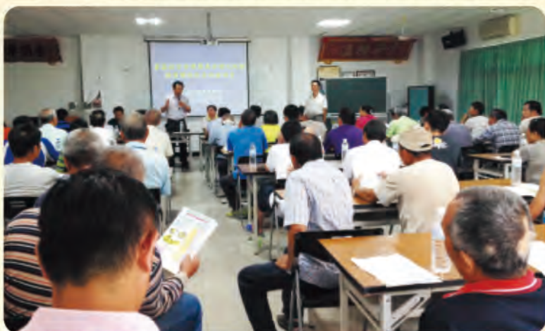
「番荔枝安全用藥講習暨與民有約座談會」農友出席踴躍

本場辦理之講習會，課程內容包括：「外銷鳳梨釋迦抽樣流程」、「臺灣農產品生產追溯系統申請規範」、「安全用藥法規」、「番荔枝農藥殘留及注意事項」及「外銷鳳梨釋迦現況」；鼓勵農友加入申請「臺灣農產品生產追溯系統」，強調遵守法規的重要性，並提醒農友，購買農藥時，務必向農藥販賣業者索取明細及收據，以維護自身權益。病蟲害防治上應該正確診斷、對症下藥，並遵守安全採收期規定及用藥規範，強調生產優質安全果品的重要性。與會農友同樣關心外銷鳳梨釋迦產業發展及農藥使用與農藥殘留等規定，並對本場辦理相關講習會表示肯定，透過大家通力合作，才能建立整體產業形象，為永續經營奠定根基。