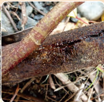
圖1c. 罹病莖部膨脹縱裂流膠