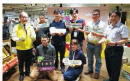
農糧署胡署長與現場嘉賓合影

推出新型態銷售平臺「農良直賣所」展示區，由臺東縣農產公司集結臺東鳳梨釋迦小農、臺東地區農會、太麻里地區農會、東河鄉農會及鹿野地區農會等鳳梨釋迦供貨單位進駐，消費者可以透過預購下單的模式，在家就可以收到新鮮的國產鳳梨釋迦，便利國人支持鳳梨釋迦。