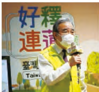
農糧署署長胡忠一主持「好釋連蓮-臺灣食在鮮國產蔬果快閃店開賣啦！」

行政院農業委員會農糧署自11月20日起至11月28日止於環球購物中心板橋車站店2樓進行為期兩週的國產蔬果快閃店活動，販售豐富多元的臺灣當季新鮮蔬果，現場亦可預購，新鮮直送到家，展售期間