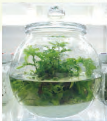
無菌之水蕨植體，體積較大適合大型無菌容器。

原生水生蕨類目前商業運用，主要為挺水盆栽及觀賞水族沉水水草。挺水盆栽價格低廉，每盆約30-40元；觀賞水族沉水水草價格略高且浮動較大，每盆約50-100元；若製作成目前市售無菌水草瓶，單價每瓶約800元，同時具有技術門檻、藍海市場、高附加價值與利潤，且無需特別照顧，適合生活忙碌的植物喜好者，應為未來水生蕨類應用之新方向。本場利用組織培養蕨類綠球體技術，首次開發出田字草及水蕨無菌瓶中植物，未來將針對關鍵技術缺口補強及開發其他種類，期許可成為蕨類產業發展方向之一。