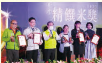
池上鄉農會(右3)勇奪2021年精饌米獎臺灣好米組及臺灣有機米組雙料冠軍

臺灣包裝食米界的最高殿堂「2021年精饌米獎」於11月9日揭曉了，池上鄉農會以「池農仙境米」及「池農有機白米」分別榮獲臺灣好米組及臺灣有機米組雙料冠軍，池上多力米股份有限公司亦以「大地有機白米」獲得臺灣有機米組季軍，富盛農經科技股份有限公司則以「樂米穀場-池上競賽履歷米」拿下臺灣好米組亞軍。池上米繼2020年精饌米獎再度勇奪雙料冠軍，6個獎項中就有4席來自臺東縣池上鄉所生產的好米，表現十分優異，為全國米界翹楚。