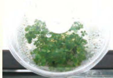
無菌之田字草植體

田字草( Marsilea minuta L.)，又稱南國田字草或蘋，為田字草科(Marileaceae)之臺灣原生多年生水生蕨類，由於受除草劑之影響，已不易發現野生族群。葉片呈四裂，貌似幸運草為其外觀最特別處，也是名稱由