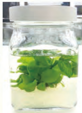
由綠球體分化之水蕨幼株，具幼年性葉片全緣，可沉水觀賞。

推出新型態銷售平臺「農良直賣所」展示區，由臺東縣農產公司集結臺東鳳梨釋迦小農、臺東地區農會、太麻里地區農會、東河鄉農會及鹿野地區農會等鳳梨釋迦供貨單位進駐，消費者可以透過預購下單的模式，在家就可以收到新鮮的國產鳳梨釋迦，便利國人支持鳳梨釋迦。