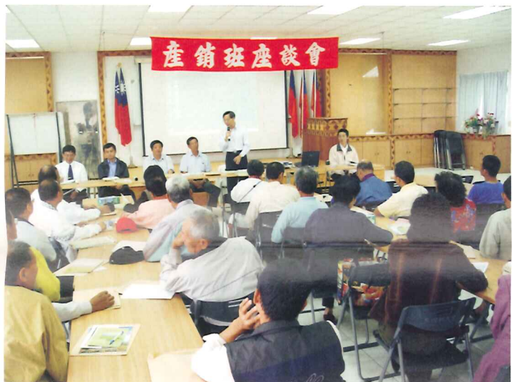
黃場長明得主持東河鄉農業產銷班幹部座談會

93年10月27日本場在東河鄉農會農特產展售中心辦理東河鄉農業產銷班幹部座談會，由本場黃場長明得與東河鄉農會葉總幹事富山共同主持。座談會進行前由黃場長明得報告「政府對農民的承諾與作為」揭開序幕，接著由本場蘇副研究員東生報告「紅火蟻的認識與防治」，並邀請本會輔導處簡嘉良技正報告「休閒農業輔導辦法」。