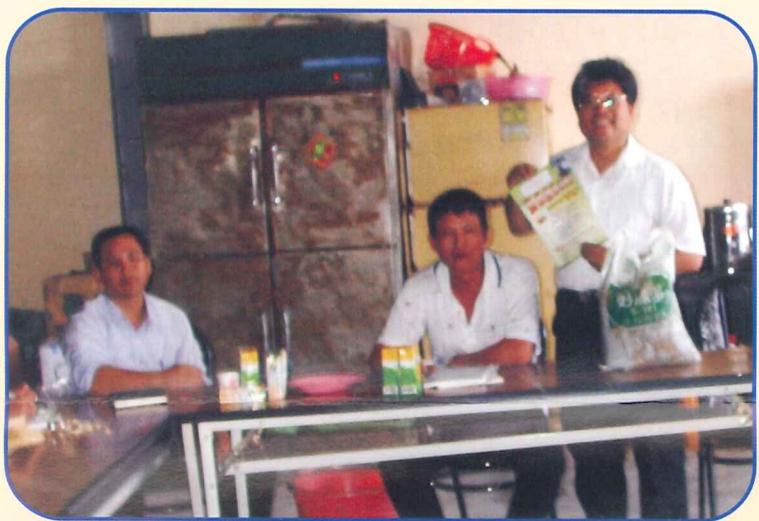
本場推廣人員參加產銷班班會時宣導農業發展基金會貸款計畫

臺灣農業經營較其它行業相對困難，農戶之總體亦較其它行業相對短少，故有必要協助其取得經營所需資金。為使產銷班班員發展自動化、資訊化、商品化及企業化經營所必要之融資服務，政府於93年度農業發展基