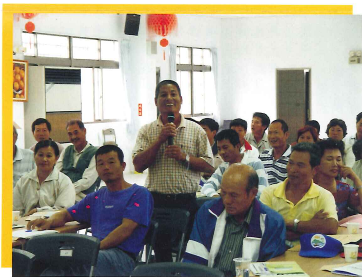
東河鄉產銷班幹部在座談會上侃侃道出在地的的心聲